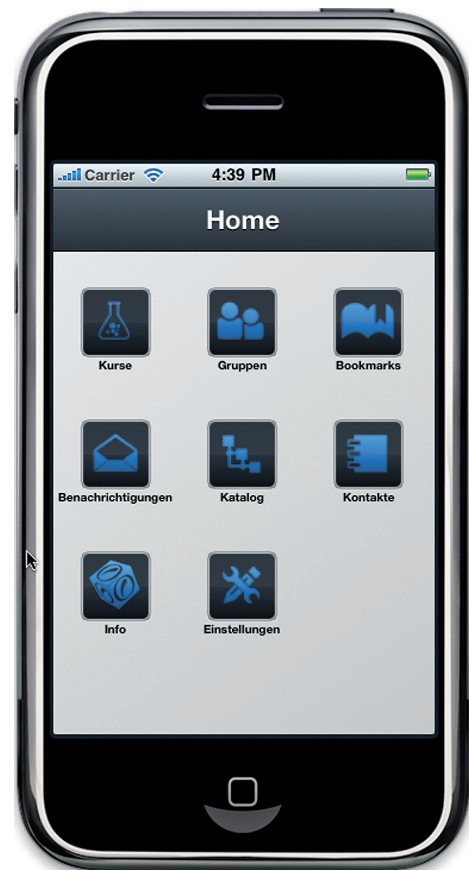
Die mobile Variante von OLAT wird gerade im frentix Lab entwickelt